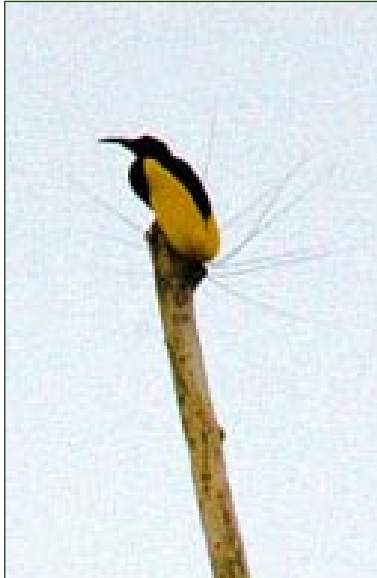
En Twelwe-wired Bird-of-Paradise utför sitt spel för honan i toppen på ett torrträd.