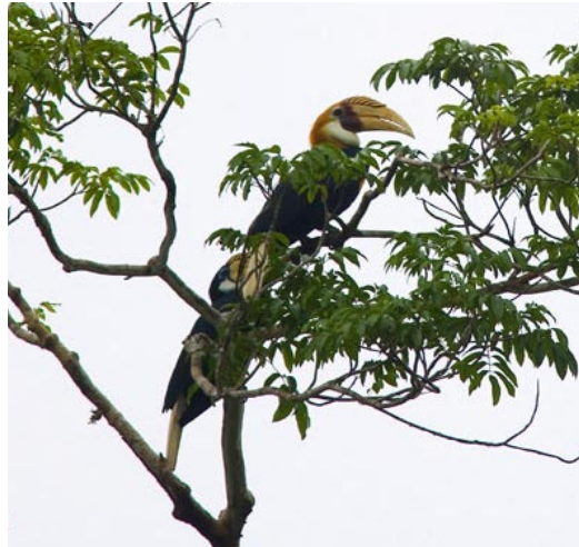
Många av regnskogens fåglar är små och svåra att upptäcka men Blyth's Hornbill kan man inte missa.