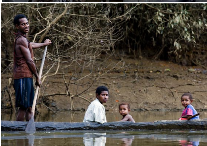
Uppifrån: En huliman går ofta traditionellt klädd även till vardags; Under fågelskådning på floden Fly är det bra att ha med sig en teleskopkikare; Floderna är naturliga färdstråk för människorna i världens tredje största regnskog som täcker låglandet på Nya Guinea.

delen till andra områden i Papua, vilket nog främst beror på de bristfälliga transporterna. Vagnätet är mycket begränsat, och de allmänna kommunikationerna på landbacken begränsas till PMV, "public motor vehicles", oftast lastbilar som fraktar folkhopar på sina flak. Ska man färdas som turist är det flyg som gäller, och Papua är stort som Sverige ungefär. Landet är världstursimens "last frontier".