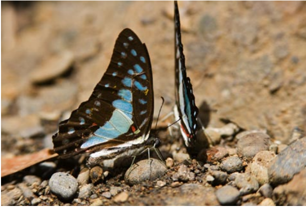
Fjärilsfaunan på Nya Guinea hör till de artrikaste i världen.